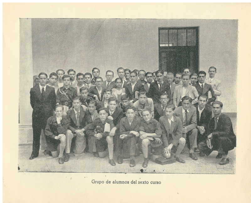
Grupo de alumnos del sexto curso

naturaleza, de sentir la admiración por la Literatura y el deseo o el anhelo y casi la seguridad de que sería yo escritora algún día". 6